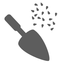
SEMILLAS Y HERRAMIENTAS